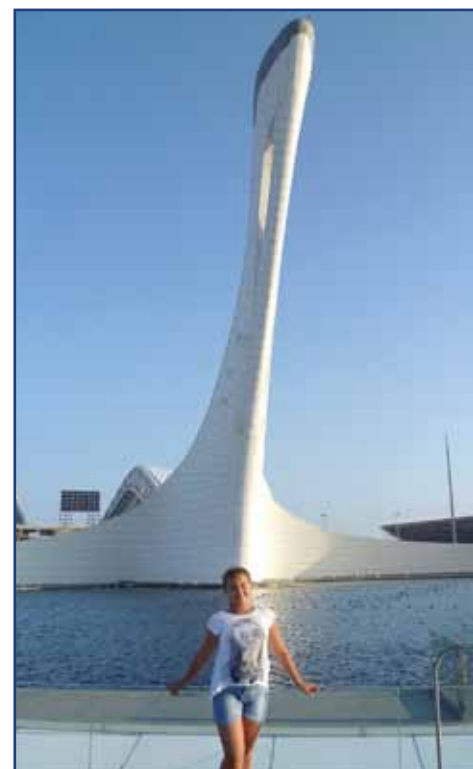
у Чаши Олимпийского огня

Вечером по поверхности фонтана пускают туман, а его брызги с помощью большого количества светодиодов